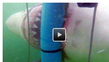
Best of Video 2015: Hai-Lights vor der Kamera Auch Weiße Haie haben eine Persönlichkeit. Manche sind beharrlich, andere ungeduldig oder gar unkonzentriert. Besonders gut und hautnah zu beobachten ist das beim Käfigtauchen vor Südafrika.