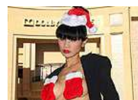
白灵清凉圣诞写真