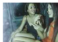
女星醉酒狂欢不雅一幕