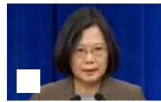
实拍蔡英文紧张口误：民主党主席