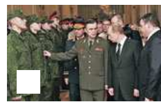
俄军组合拳震惊美 美上将直呼罕见