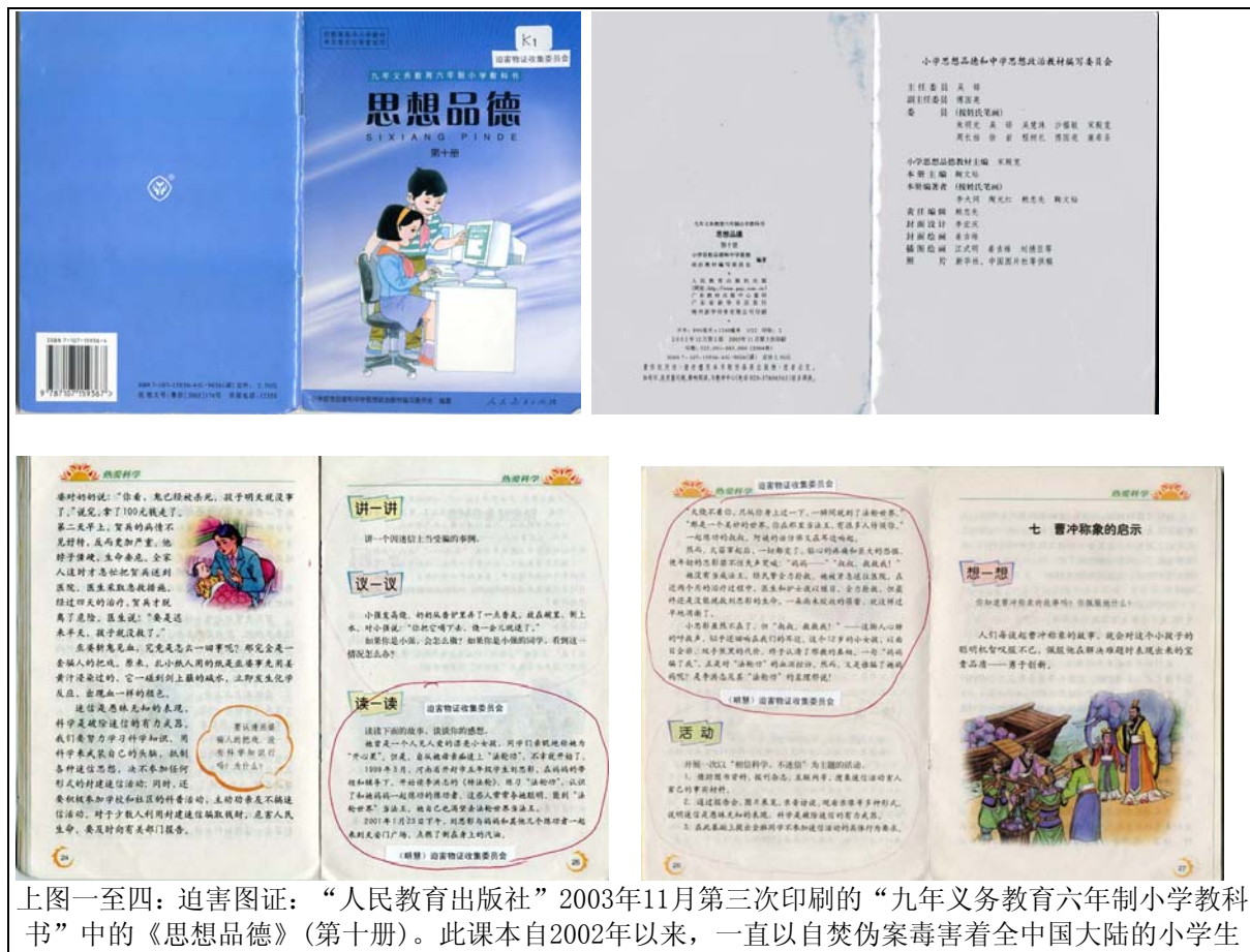
上图一至四：迫害图证：“人民教育出版社”2003年11月第三次印刷的“九年义务教育六年制小学教科书”中的《思想品德》（第十册）。此课本自2002年以来，一直以自焚伪案毒害着全中国大陆的小学生

邮政信箱: P. O. Box 365506, Hyde Park, MA 02136 USA