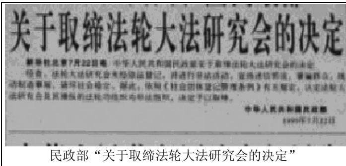
民政部“关于取缔法轮大法研究会的决定”

邮政信箱: P. O. Box 365506, Hyde Park, MA 02136 USA