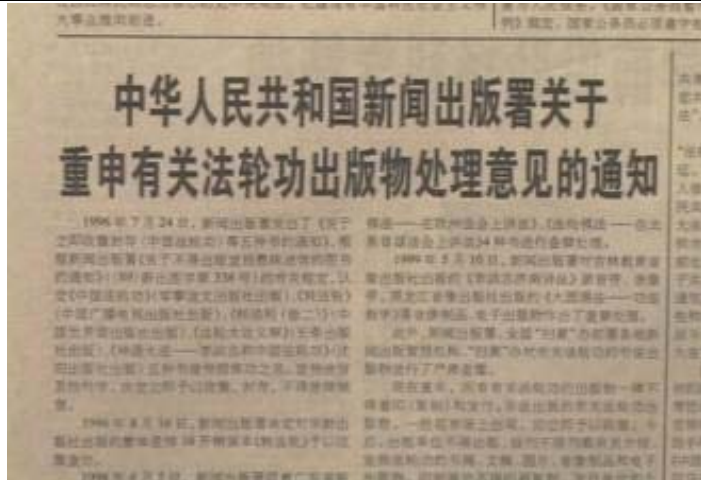
中国新闻出版署通知，所有法轮功的出版物一律不得重印，发行。

网站: www.upholdjustice.org 电话: 1-866-732-8439 传真: 1-617-325-8729 信箱: contacts@upholdjustice.org