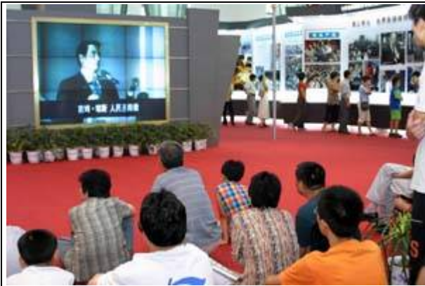
反法轮功大型展览

网站: www.upholdjustice.org 电话: 1-866-732-8439 传真: 1-617-325-8729 信箱: contacts@upholdjustice.org