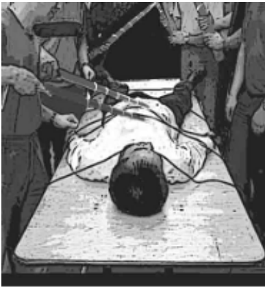
法轮功学员被电刑的场面。

这一下就给录了像了。后来我一看电视，原来是这么回事。还有下象棋那个情节，你不知道中国的劳教所制度是非常严厉的，录像那天，他们拿来了象棋，扑克，让大家一起来玩。也叫我一起来玩，我说我不会玩这些，也不懂下象棋。他们说：你不懂就坐这里看看，边说就边硬把我按在椅子上，一坐下就又录了像了。完全都是骗局！”（10）