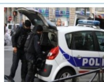
巴黎发生人质劫持事件