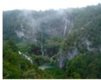
“欧洲九寨沟”十六湖