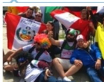
俄罗斯世界杯游记