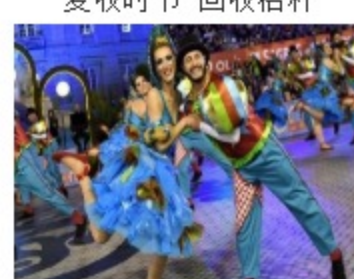
葡萄牙上演城市狂欢