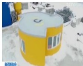
3D打印房屋遍地开花