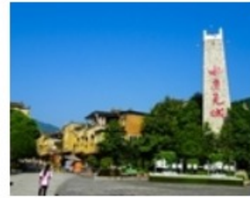
走进震后重建水磨光城