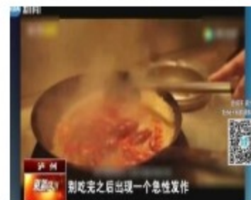
小龙虾的食用禁忌