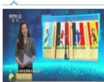
值得期待的世界杯球员