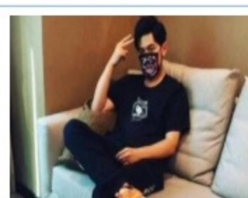
周杰伦与粉丝约北京见