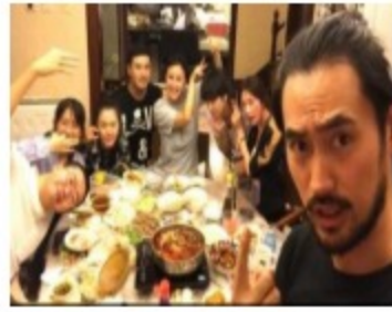
华晨宇晒与多位明星合影...