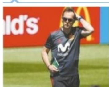
西足协官宣临阵换帅