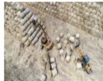
麦收时节 回收秸秆