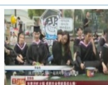
毕业季坐草坪吃火锅