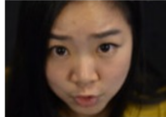
匆匆那年也许只有“那年”