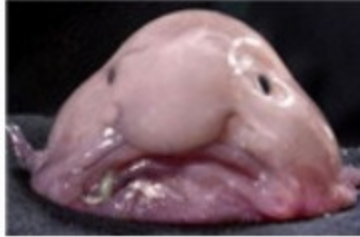
15种怪异动物 加外星来客