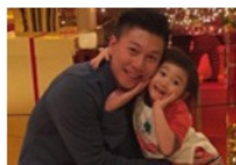
奥莉撒娇妻爸爸拍照