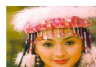
因车祸烧炭的年纪明星