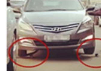
骚年有特别的停车技巧