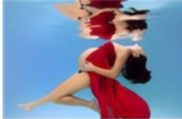
孕妇拍水下写真照如美人鱼