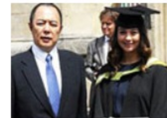
明星混血子女颜值亮相