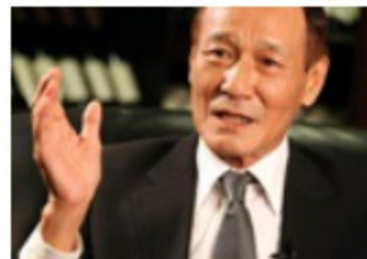
黑帮大佬还原娱乐圈往事