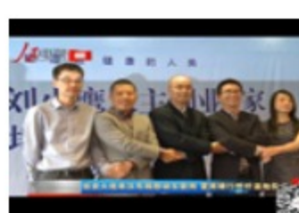
投资大佬来汉布局移动互联网