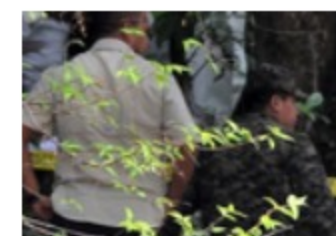
世界小姐被杀抛尸河边