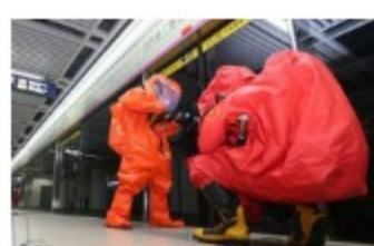
湖北消防进行防爆演习