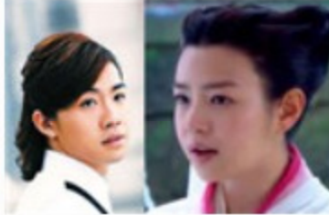
娱乐圈明星撞脸大盘点