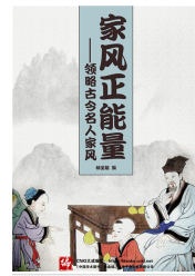
家风正能量——领略古今人家风