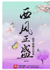
西风正盛——田宇短篇小说选