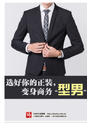
选好你的正装,变身商务“型男”...