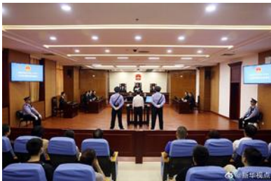
热点：张茂才被逮捕•20..