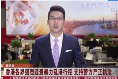
香港各界谴责暴力乱港行..