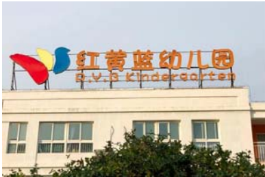
法治热点：京津冀率先实..