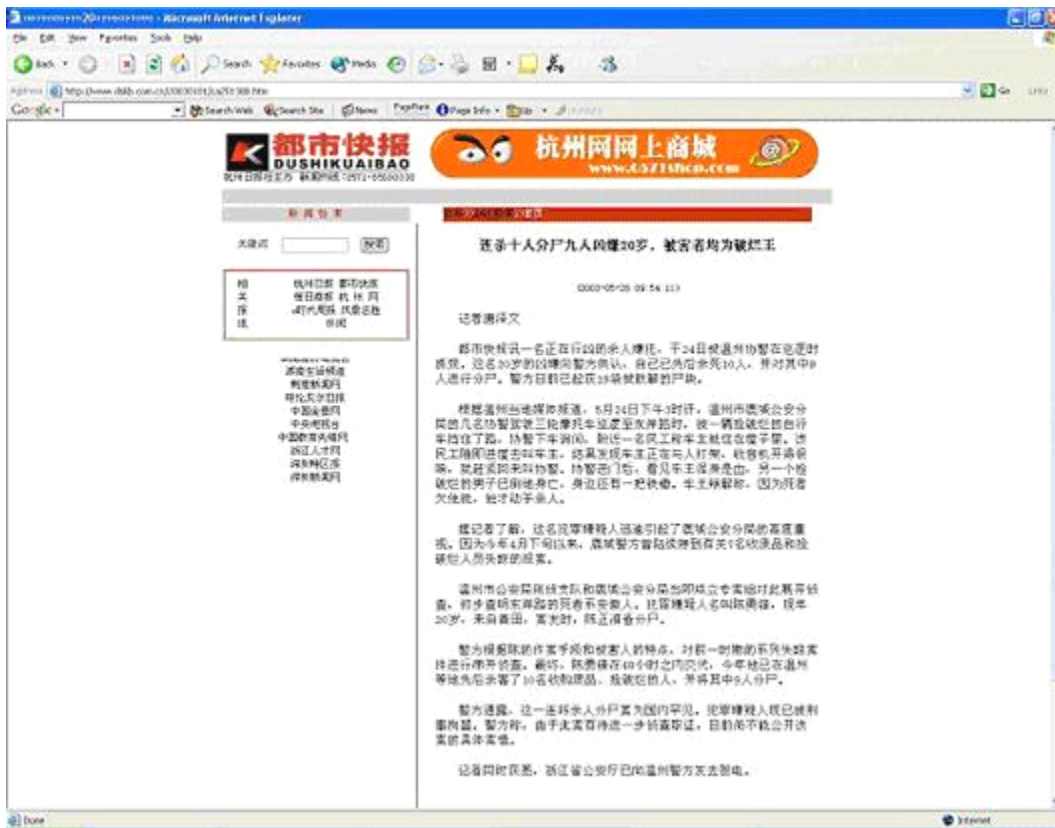
图片三：都市快报网页文章 (2003-05-20 09:54:13)