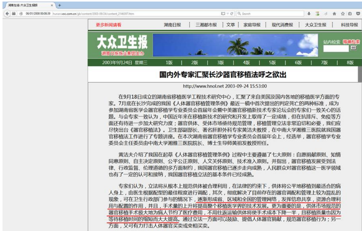
2004年9月大众卫生报网页快照

跟据分析，卫生部在军队的参与下，在全国各地设有大型的器官库，但如何调配协调这些器官库，使其能最大限度的“充分利用”，就需要一个全国性的调配中心，湘雅三院凭籍其在器官移植行业的龙头老大地位，很可能就充当了全国器官调配中心的作用，否则就不会说“不用往返运输供体将使手术成本下降一半”了？