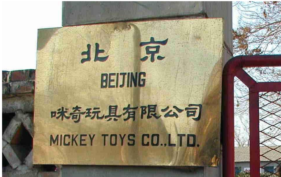
图：北京咪奇公司大门标牌照片。

北京咪奇玩具有限公司成立于1987年，是集毛绒玩具及毛绒制品的设计、生产、销售、出口于一体的中外合资企业。年产量在20万打以上。产品出口到美国、加拿大、澳大利亚、丹麦、巴西、匈牙利、日本等国，并在东南亚地区占有一定的市场份额。 9