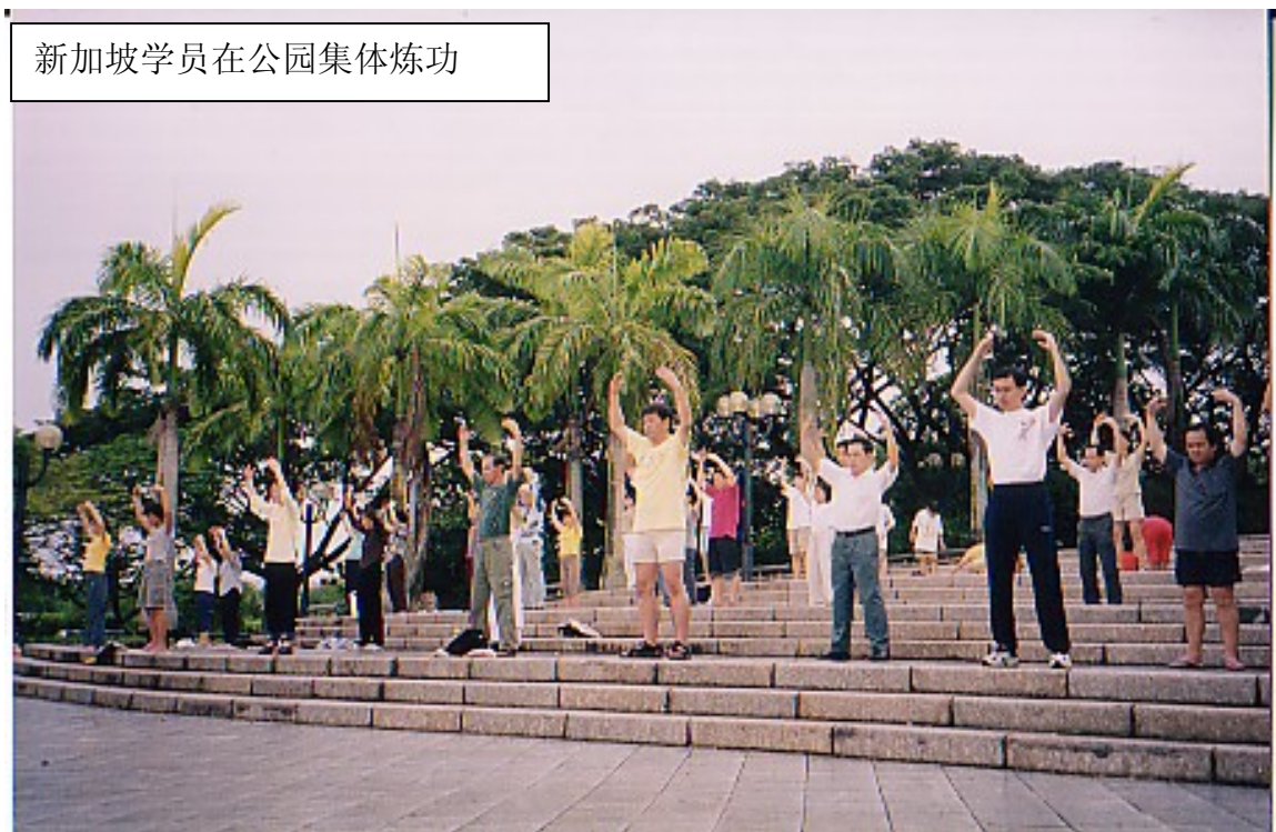
新加坡学员在公园集体炼功