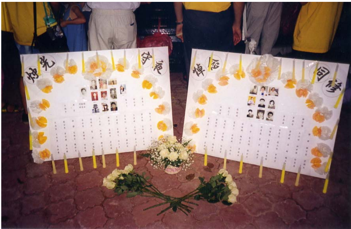
这张照片摄于 2000 年 12 月 31 日晚现场。两块板上印有被迫害致死的 107 名中国学员的名单和他们的照片。左边板上写有“烛光晚会”，右边板上写有“悼念同修”。

在整个过程中，三辆大型警车、多辆小型警车陆续到达。经过几个小时的对话无果后，警方采取行动强行没收两块板子并拘捕 15 名学员。其后 15 名学员被控上法庭，7 人被判入狱一个月，8 人被罚款 1000 新币。