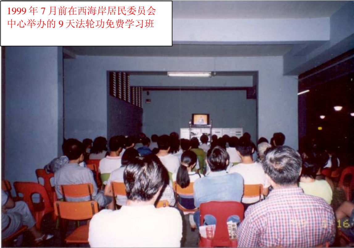
1999 年 7 月前在西海岸居民委员会中心举办的 9 天法轮功免费学习班

Association, 简称 PA) 重新提出申请, 但都被拒绝。然而其他许多种收费气功和健身活动却可以照常使用这些设施。