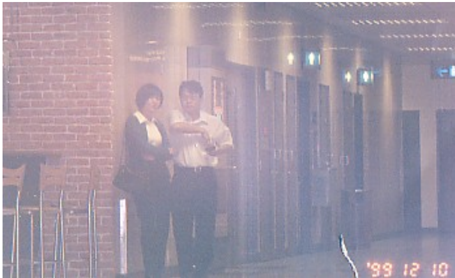
两名疑是中国特工的人在附近监视学员 1999 年 12 月 10 日

1999 年 12 月 10 日，一群新加坡法轮功学员正在樟宜机场办理去参加香港法轮大法修炼心得交流会的登机手续。几个可疑是中国特工的人一直在附近监视学员的行为，以下这张照片摄于当时现场，一男一女正在监视学员。