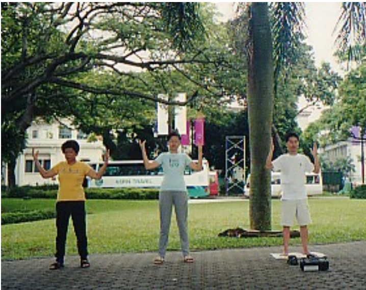
This is the site at Esplanade Park where three practitioners were inspected. The persons in photo are not the three Falun Gong practitioners inspected and temporarily detained by the police officers

江礼华和王宗斌（80岁，持长期社交访问准证），宋任（译音）是新加坡国立大学的研究生，邱楠楠是新加坡永久居民。