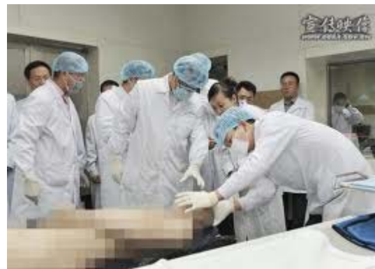
王立军 2008 年 6 月调任重庆，指示重庆警局要加快无创伤解剖的实践应用。 xi