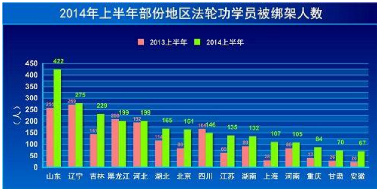
图：截止到2014年7月7日明慧网不完全统计，各地法轮功学员被绑架人数

lvi 。全国法轮功学员被绑架数量也增多。2013年下半年明慧网报道出来被中共绑架到洗脑班的法轮功学员达1044人，是2013年上半年的5倍多（上半年不完全统计为181人） lvii 。另据不完全统计，2013年上半年共有2095名法轮功学员遭绑架，而2014年上半年共有2987名法轮功学员遭绑架。这些绑架分布全国30个省市自治区，其中山东、吉林、北京、江苏、上海、重庆、安徽、甘肃的绑架数量翻倍，上海翻了近3倍 lviii 。